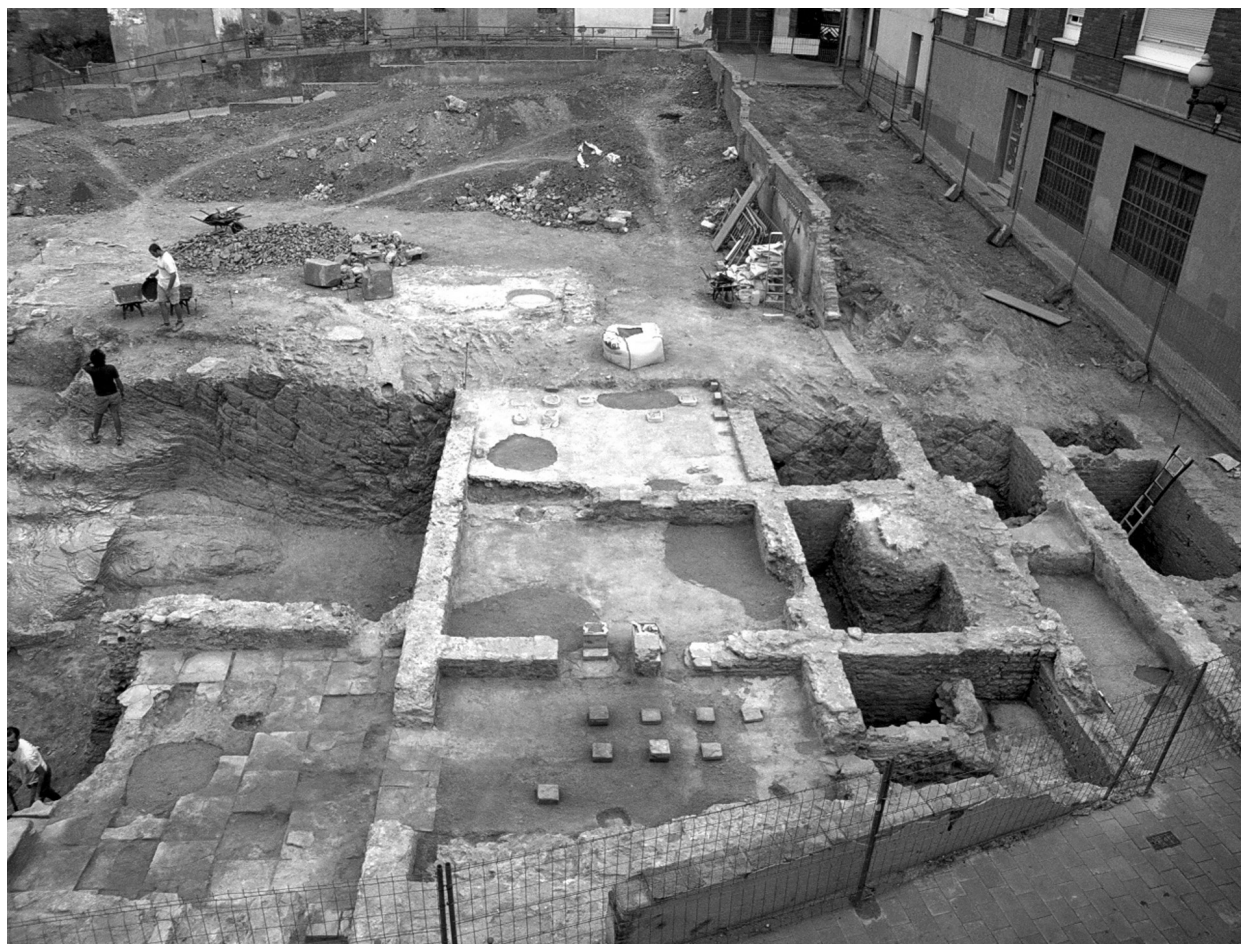
FIGURA 36. Excavacions de la plaça de la Constitució.

Al segle I dC, amb els romans al capdavant de l'Imperi, es construïren unes termes just a sobre del forat deixat per la mina, per la qual cosa va ser necessari reblir aquest gran forat, cosa que es va fer amb materials anteriors, procedents de l'entorn immediat, dels segles II-I aC i la primera