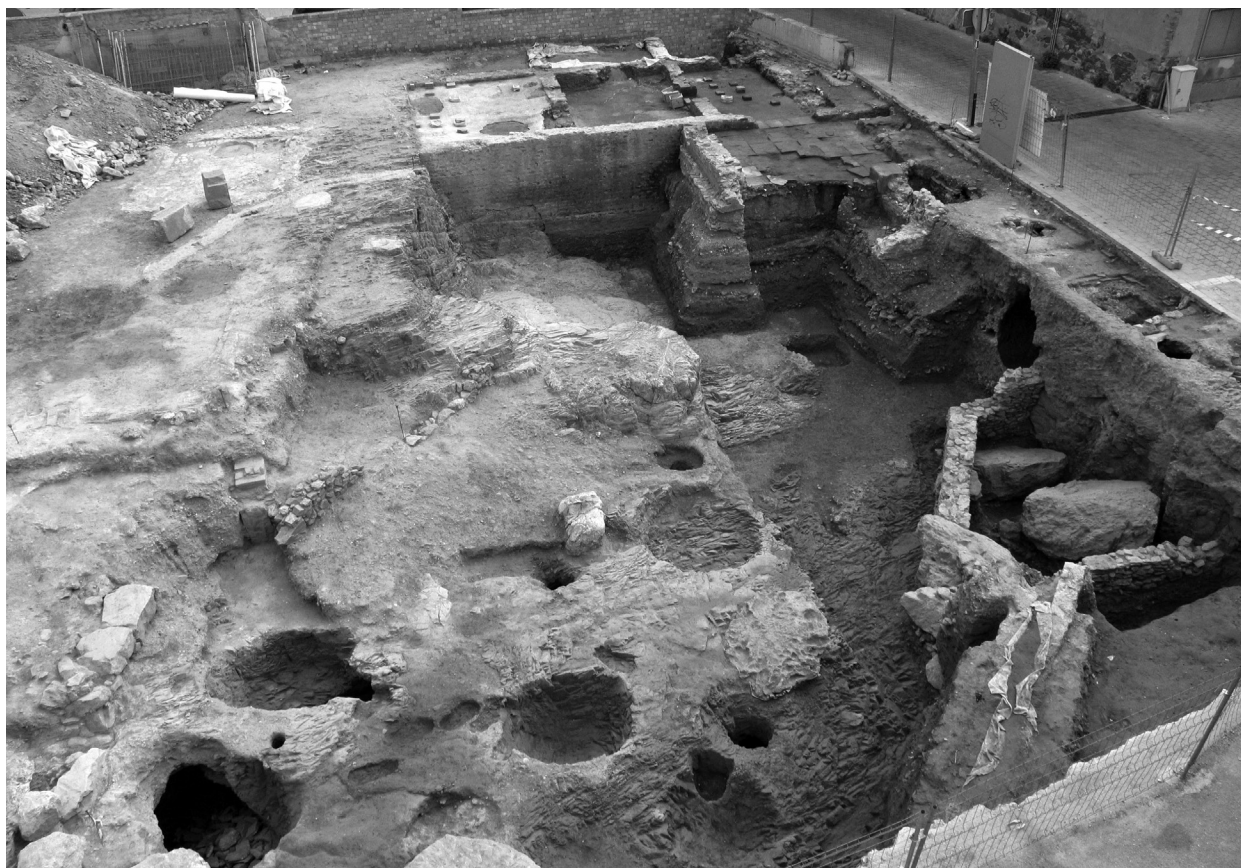
FIGURA 35. Excavacions de la plaça de la Constitució.

Aquesta va ser la que considerem la primera excavació realitzada amb metodologia estratigrà-