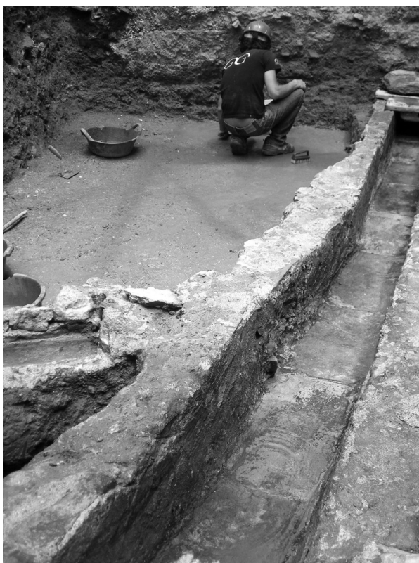
FIGURA 34. Excavacions de Can Barraquer.

La intervenció duta a terme l'any 2002 tenia com a objectiu l'excavació en extensió del casal, per tal de valorar íntegrament les restes i decidir quines formarien part del Museu. Paral·lelament es va documentar la desconstrucció de la casa mateixa, Can Barraquer, i es va establir un diàleg entre arquitectura i restes arqueològiques.