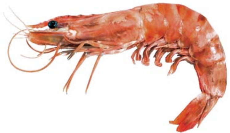
El llagostí no sembla pas menys apreciat que la gamba, però el DIEC, que el descriu detalladament, no en diu res

Les subentrades en la nomenclatura del DIEC dedicades a aquesta mena de definicions, és a dir, corresponents a noms d'animals usats en sentit figurat, no són pas escasses,