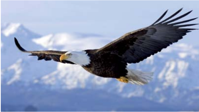
Perspicaç com una àguila