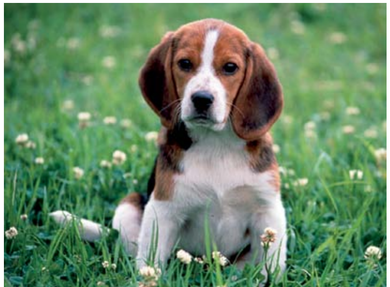
Fidel com un gos

En alguns casos, com si l'ús d'aquests noms d'animal no es considerés prou consolidat, el DIEC recorre a exemples comparatius: Lleuger com una daina , Córrer com una daina , Fidel com un gos , Poruc com una llebre , Dormir amb els ulls oberts com les llebres , És valent com un lleó , Defensar-se com lleons , Es van batre com lleons , Menjar com un llop , Tenir una fam de llop , Arrapar-se com una llagasta . Hi ha, també, els casos en què es parteix de la base que el nom de l'animal ha originat una frase verbal, a la qual, per tant, es concedeix una subentrada amb la definició corresponent: Ésser una aranya «No deixar escapar cap avinentesa de guany, saber-se aprofitar de tot» (s.v. aranya), Estar