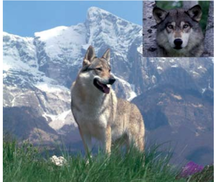
El llop, segons el DIEC, és un animal molt voraç

prou aliment al seu abast, cosa que en el cas del llop, per la seva natura i pel medi en què li ha tocat de viure, no sempre s'ha esdevingut.