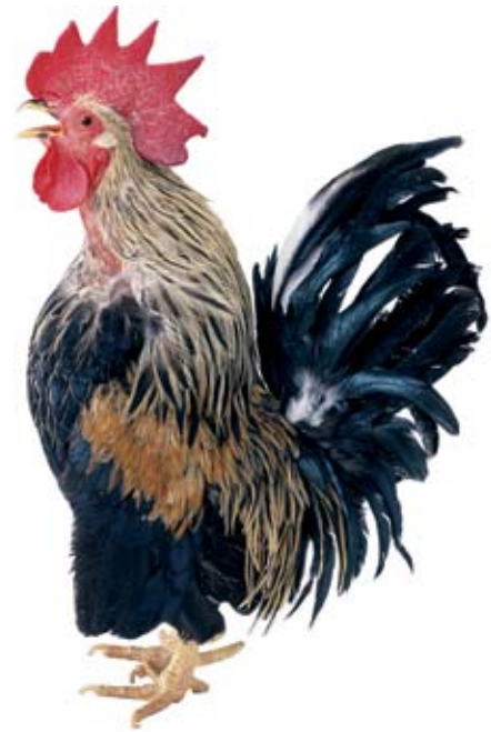
De qui vol imposar la seva voluntat en el seu ambient es diu que és un gall

Hi ha noms d'animal que s'usen en certes ocasions determinats per un altre nom que designa el seu hàbitat en principi natural. Podem dir els següents: conill de bosc, pardal de bardissa, ànec de riu, truita de riu, cranc de riu, llagosta de rostoll, cuc de terra, musclo de roca, rata de claveguera, gat de teulada, eriçó de mar, perdiu de mar,