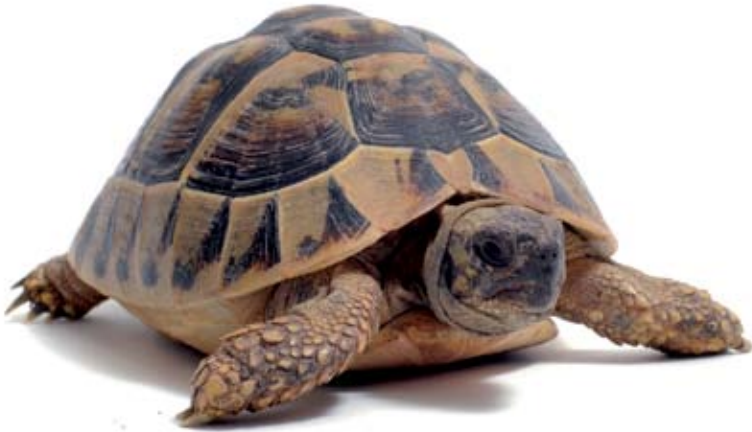
De qui va molt a poc a poc diem que és una tortuga

com una cabra «Ésser eixelebrat, esbojarrat», «Estar esvalotat» (s.v. cabra), Fer l'ànec «Morir» (s.v. ànec), Fer el mico «Fer ximpleries» (s.v. mico). Fer la rateta «Projectar sobre alguna cosa la llum reflectida per un mirallet» (s.v. rateta).