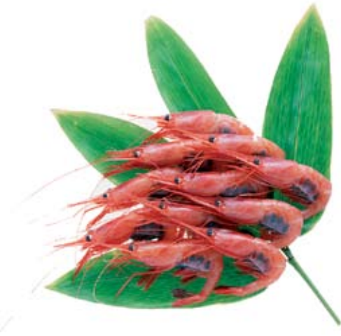
La gamba vermella, segons el DIEC, és un crustaci molt apreciat en gastronomia

No hi trobem, però, una informació anàloga sobre els ànecs (amb 21 espècies diferents), el francolí, el tord i la tórtora, a part d'altres moixons més aviat petits, com és ara el pardal, apreciats per certs gastrònoms, o, ocasionalment, per alguns famolencs!