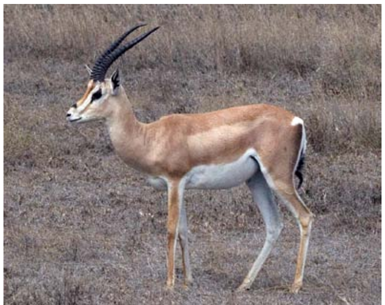
Esvelta com una gasela

serpejar, serpentejar Anar, estendre's, segons una línia sinuosa, formant meandres.