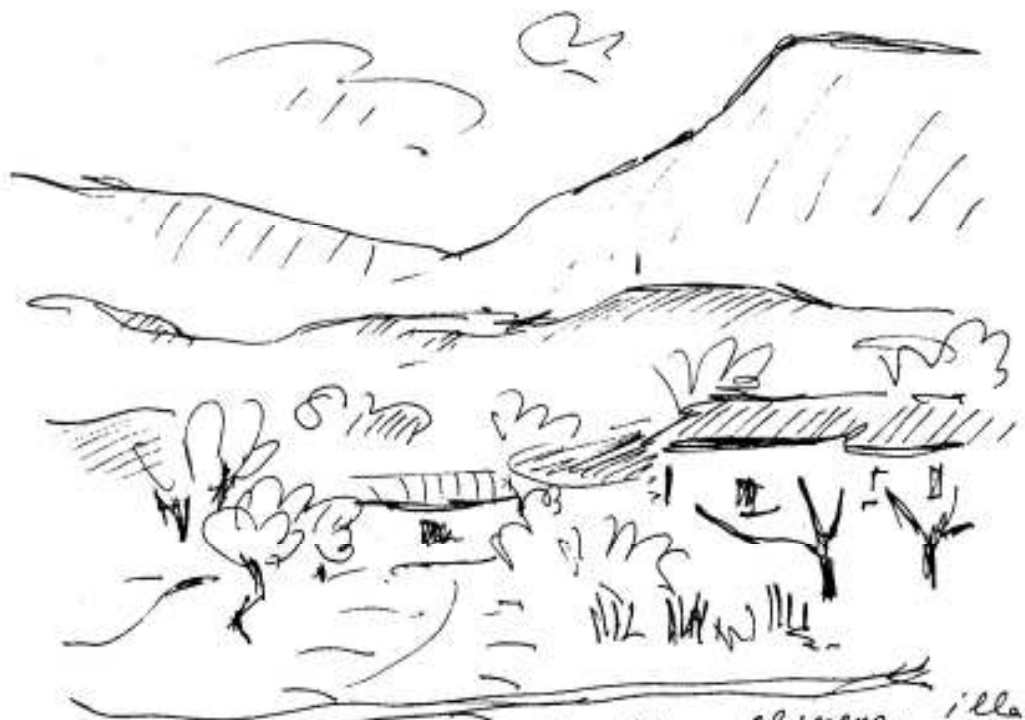
vista de la finestra de casa el meus. illa