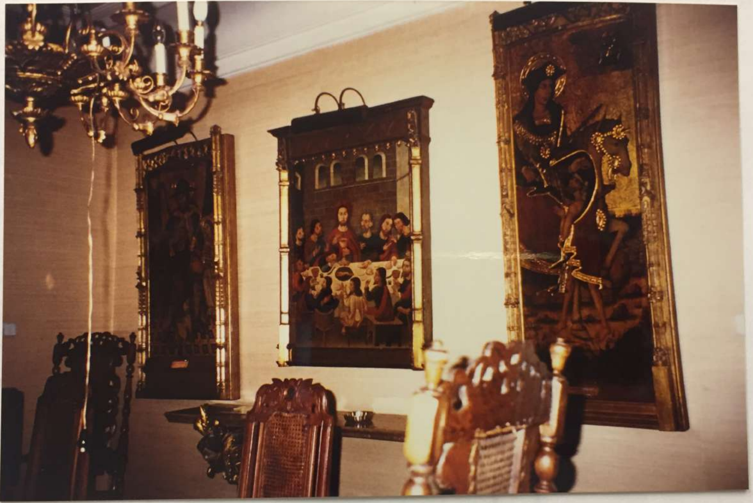
Sant Sapor . Menjador