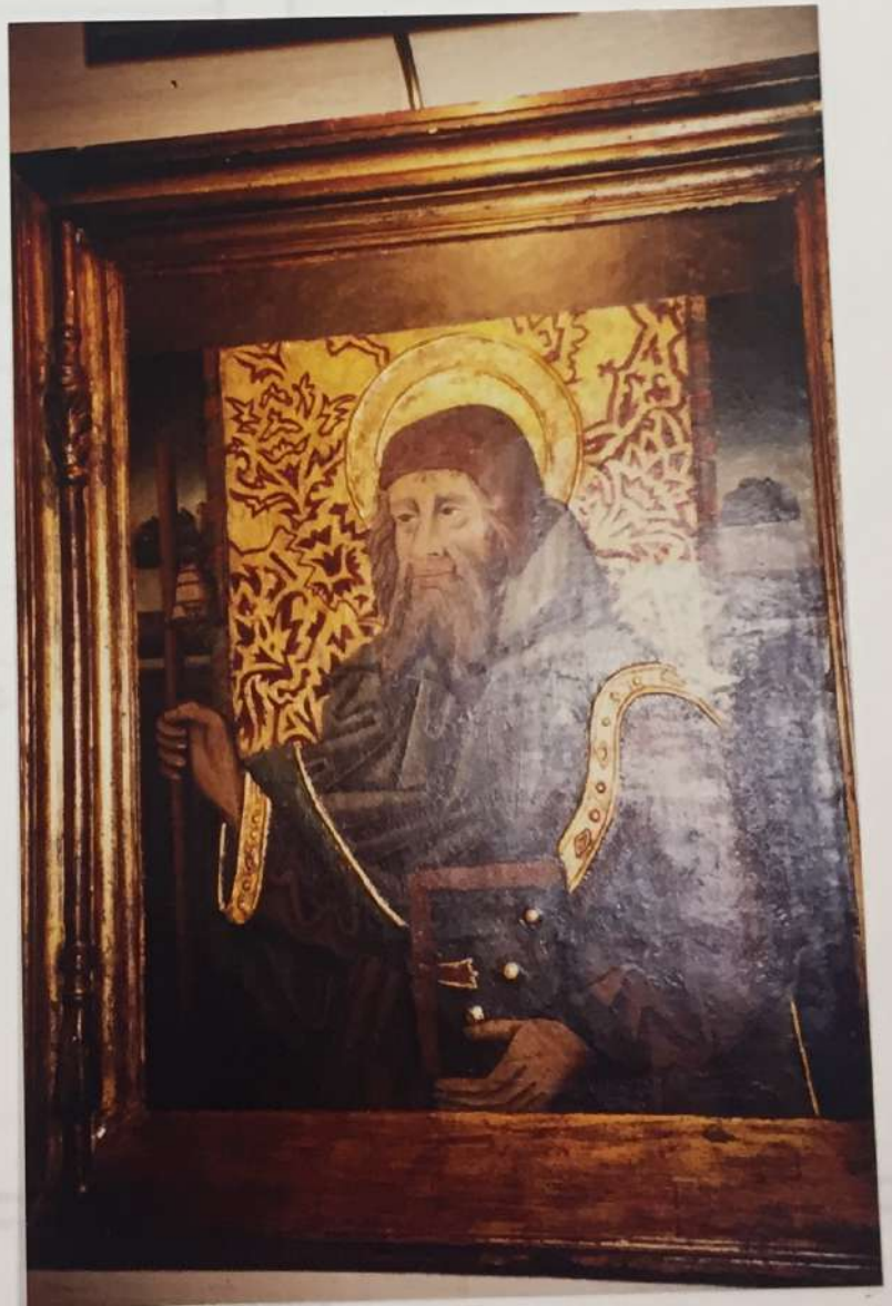
Sant Antoni Abat