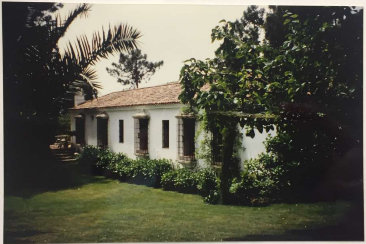
Casa de camp a Piedralover (Aviela)