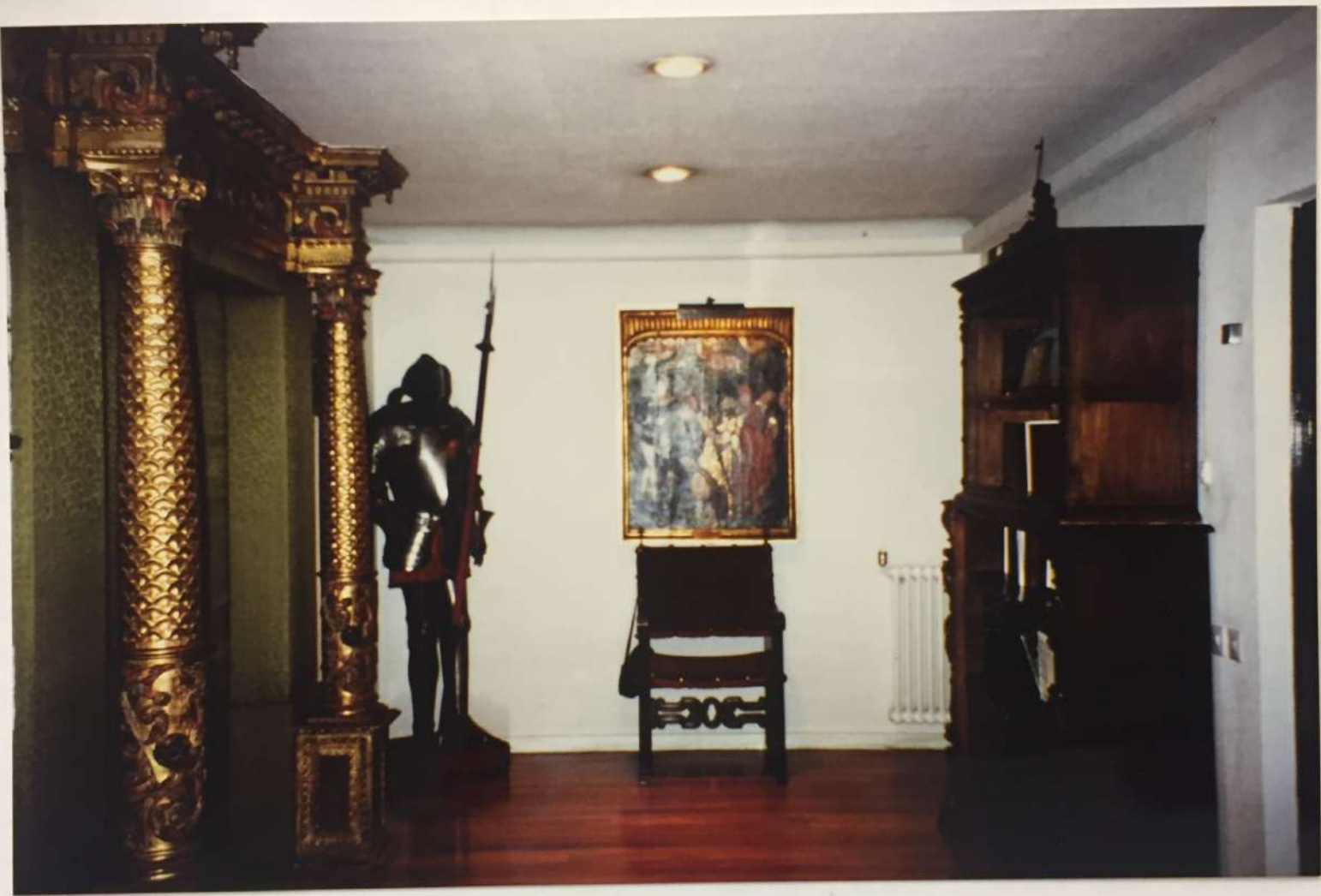
Rebedn del despatx particular.