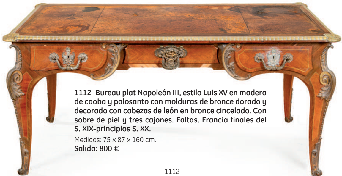
1112 Bureau plat Napoleón III, estilo Luis XV en madera de caoba y palosanto con molduras de bronce dorado y decorado con cabezas de león en bronce cincelado. Con sobre de piel y tres cajones. Faltas. Francia finales del S. XIX-principios S. XX.