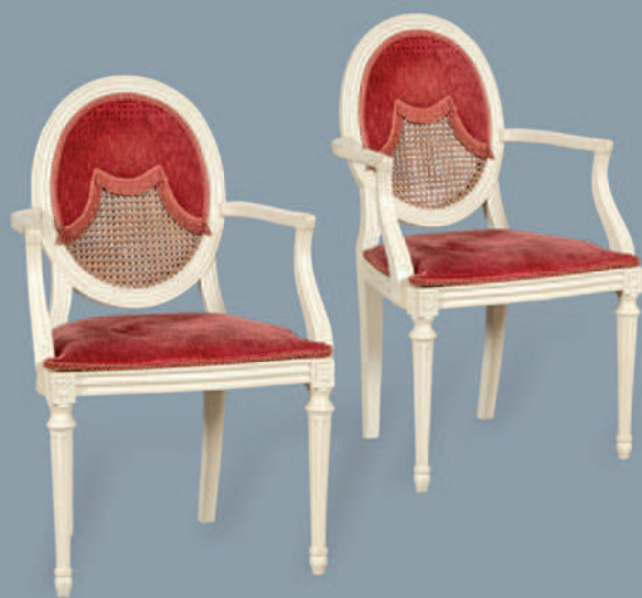
1129 Parte del lote