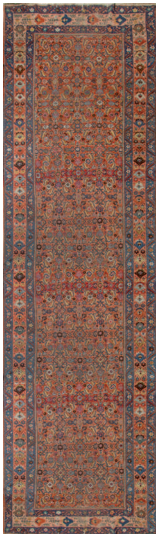
1498 Alfombra de pasillo Kelleh, tipo Feraghan, en lana, oeste de Persia, h.1890. Desgastada y con algunos daños.