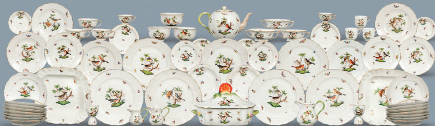
1128 Parte del lote

Hungría, marcada y numerada en el reverso.